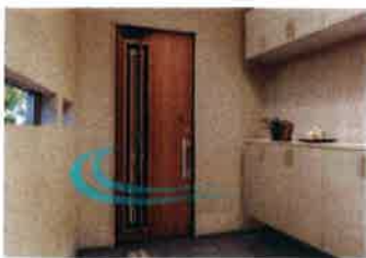
LIXIL 採風ドア ジエスタ2