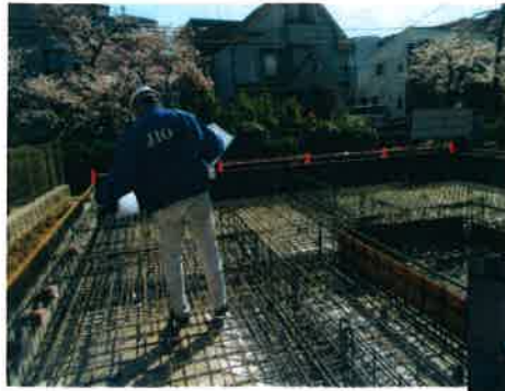
←配筋検査を行っているところ (検査機関 JIO)

当社では基礎工事はべた基礎を採用しています。 べた基礎とは、建物の床面全体に鉄筋コンクリートを敷き詰める基礎の事です。 面全体で建物を支えるので、地盤の荷重負担が減るとともに基礎全体の剛性も高まり、地震や台風などの衝撃を効果的に地面に逃がす事ができます。 べた基礎は、地面全体を鉄筋コンクリートで覆ってしまうので、シロアリへの侵入を防いだり、地面からの水蒸気を防ぐ事ができます。