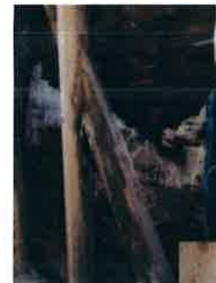
瑕疵保険を使い、 補修工事をした 一例です。