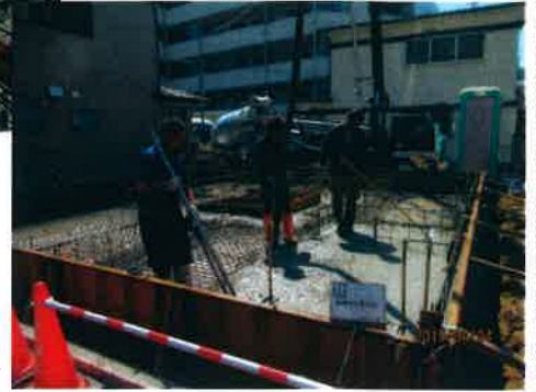
生コンを流しているところ→